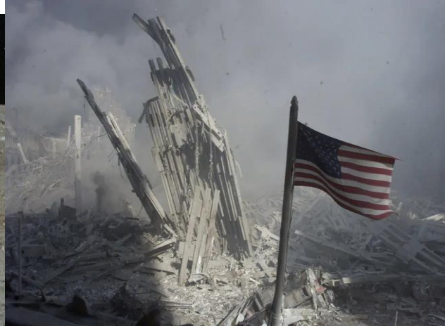
Destroços do World Trade Centre, em Nova York (2001)